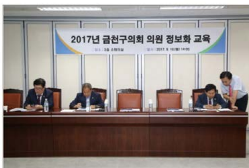
▲ 금천구의회 의원들이 스마트폰을 이용한 정보화 교육을 받고 있다.