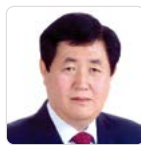
김용진 의원 Kim Yong-Jin

Electoral district 'Da' (Siheung-dong 1, 4)