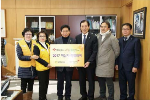
금천구의회가 2017년도 적십자 특별회비를 납부 하고 나눔 문화의 확산을 위한 노력에 동참한다.

[아시아일보/김응수 기자]금천구의회가 2017년도 적십자 특별회비를 납부 하고 나눔 문화의 확산을 위한 노력에 동참했다.