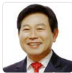
정병재 의원 Chung Byeong-Jae