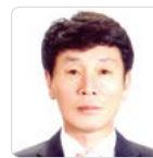
백승권 의원 Baek Seong-Kwon