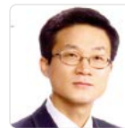
류명기 의원 Ryu Myung-Ki

Electoral district 'La' (Siheung-dong 2, 3, 5)