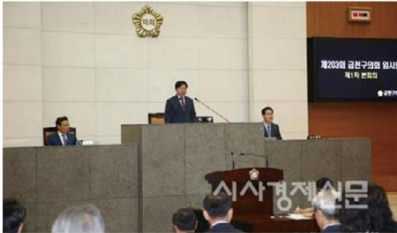
▲ 제203회 임시회 폐회 모습.

금천구의회, 제203회 임시회 폐회 추가경정예산안 처리, 재정운영 효율성 UP