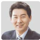
김영섭 의원 Kim Yung-Sup

Electoral district 'Na' (Doksan-dong 2, 3, 4)