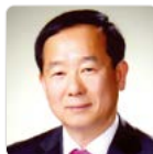
박찬길 의원 Park Chan-Kil