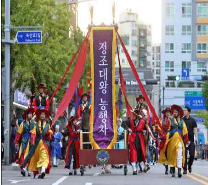
정조대왕 능행차 재현