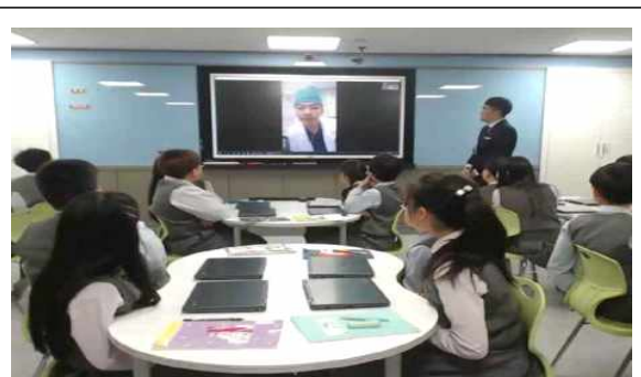
원격 화상 연결수업