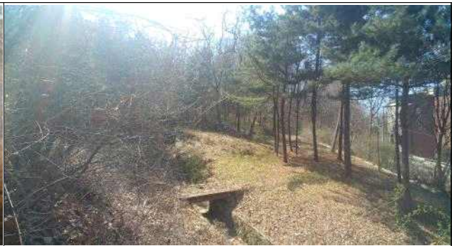
시흥동 산 73-2