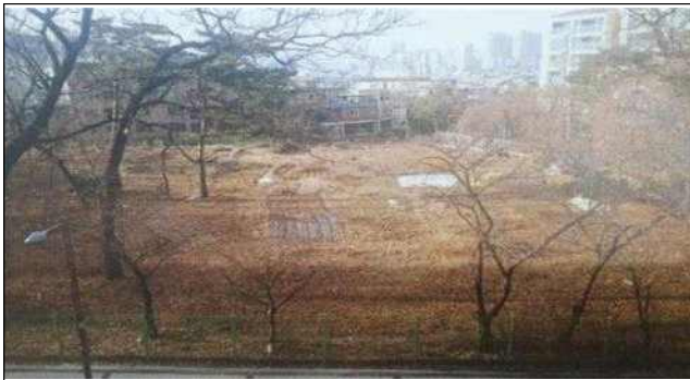
시흥동 산 77-6외 5필지