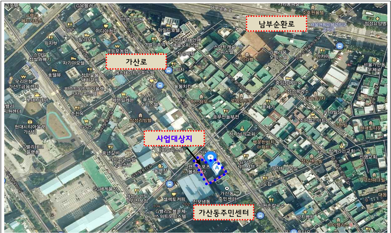
가산동 144-2번지(가산동주민센터, 가산생활문화센터 옆)