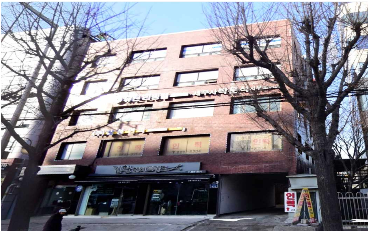
생활SOC 가족센터 복합시설 조성 위치도 및 전경 사진