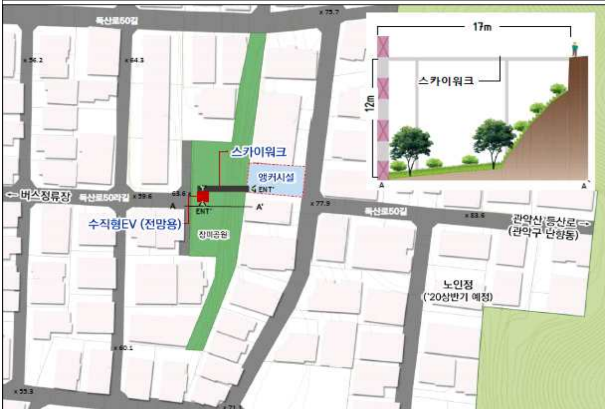
부지여건 및 위치도