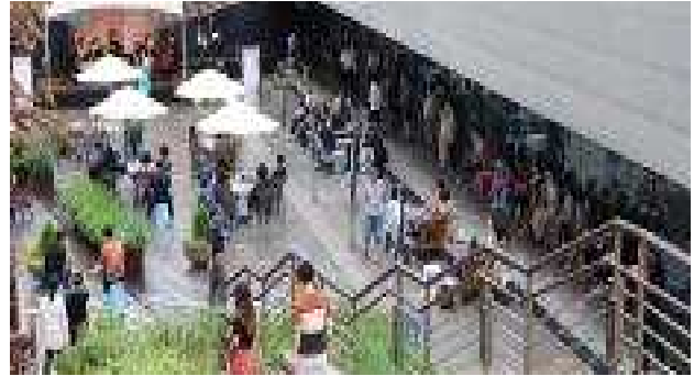
금천아트리지 '금천교향악단' 야외공연