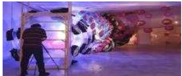
여름방학 특별전시 '플레이폴가든' (대면/비대면전시)