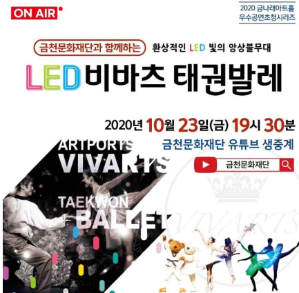
우수초청공연 실황공연 생중계 및 대면초청