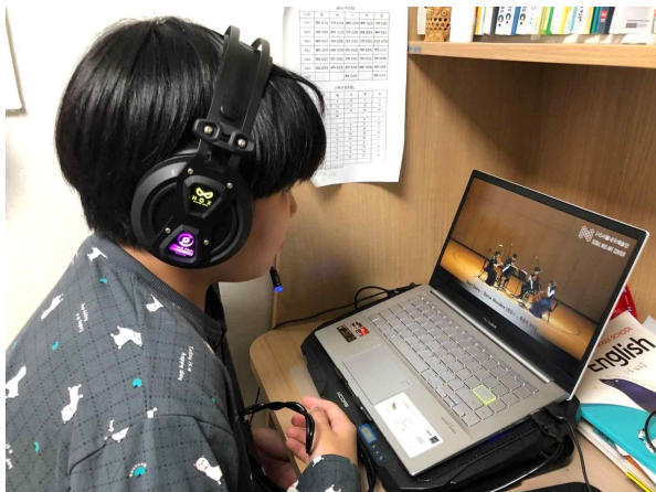
시청각 공연 수업(강사들 공연 관람)