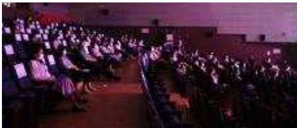
오색오감토요콘서트 '덕분에 콘서트' 대면공연