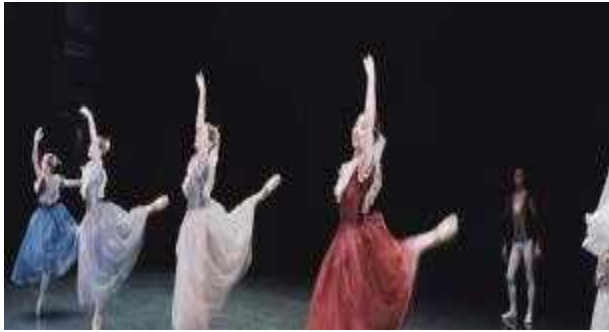
오색오감토요콘서트 '해설이있는발레갈라' 온라인 공연