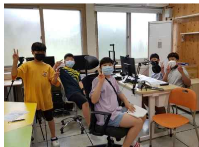
라이브 녹화 이미지