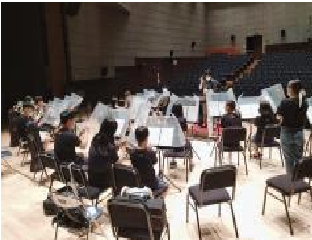
2020 금나래아트홀 집중교육 <여름캠프> 2020. 8. 7 13:00~18:00