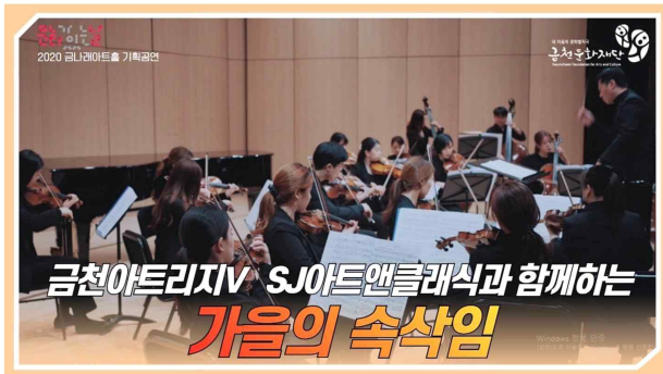
문화의날 온라인 공연