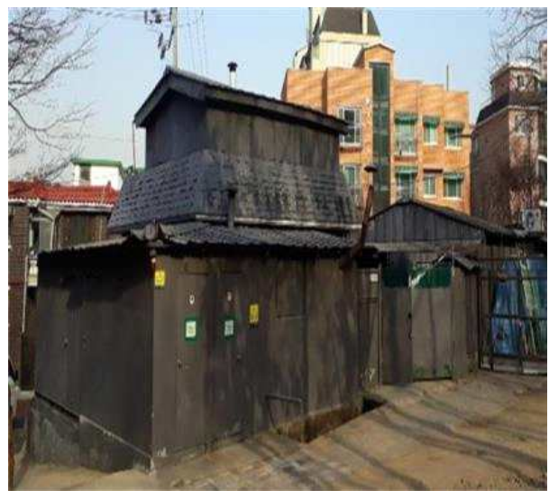
커뮤니티 센터 대상지