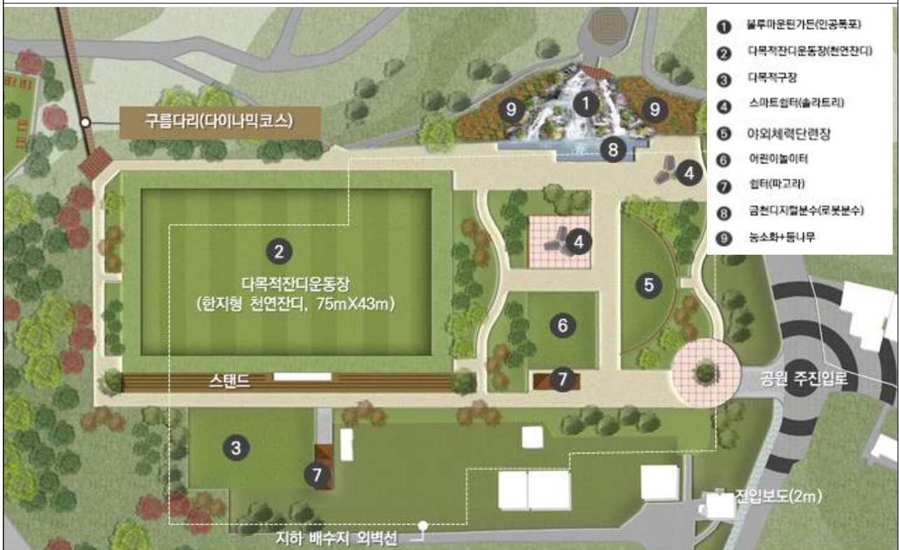
금천체육공원 조성 계획(안)

감로천생태공원-금천정-산울림다리-독산자락길-독산배드민턴장-베짱이유아숲체험장-금천체육공원을 연결하는 약 1.7km의 순환산책로 조성(1시간 내외 산책길)