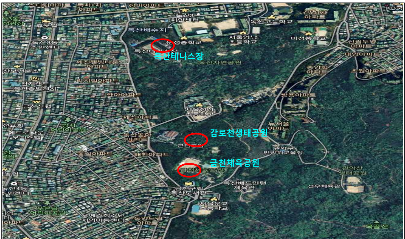
금천체육공원일대 다이내믹 파크 조성 대상지