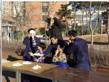
온라인 예술 콘텐츠 개발 지원