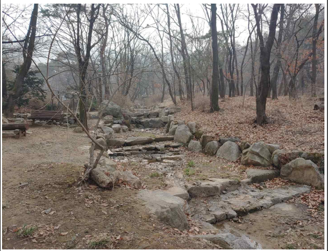
시흥계곡 생태계류 복원